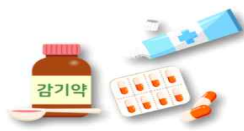
일반의약품 - 처방전 없이 구입 가능