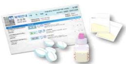
전문의약품 - 처방전 필요